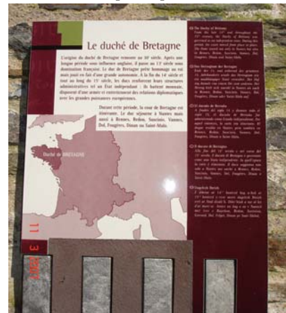
Plaque en extérieur, dans l'enceinte, sur la rampe menant à la poterne de la Loire.

La carte, sans date précise, souligne bien l'importance du Duché par rapport au royaume de France. il s'agit de l'unique évocation du contexte géographique présenté dans le circuit d'accès libre, environ 500 m de ramparts et courtines.