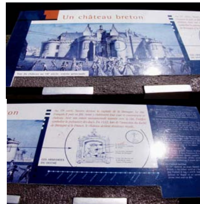
Vues de la plaque posée en extérieur et sur la voie publique, à gauche et avant l'entrée principale.