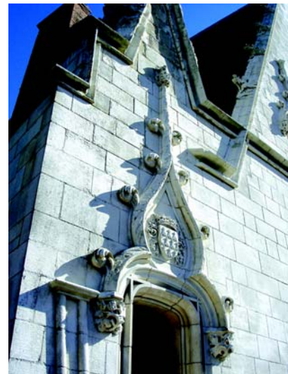
Détail de la façade de la tour du Fer-à-Cheval

Le Conseil régional de Bretagne prépare l'organisation d'une grande semaine à Paris sur le thème la Bretagne à Paris du 17 au 23 septembre : économie, culture, tourisme, identité et image de marque. Les cinq départements seront concernés. Le clou de l'opération sera un défilé de nombreux bagadoù sur les Champs Elysées le dimanche 23 septembre. La Région B4 comme le CG44 misent beaucoup sur les symboliques de cette opération, sur son impact tant auprès des médias nationaux qu'internationaux et sur ses retours (en boomerang) sur les cinq départements de la Bretagne. Avec un budget considérable, autour de 1,3 million d'euros.